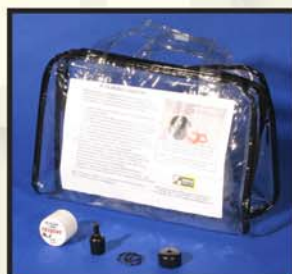
SPARE AIR Travel Pack #963