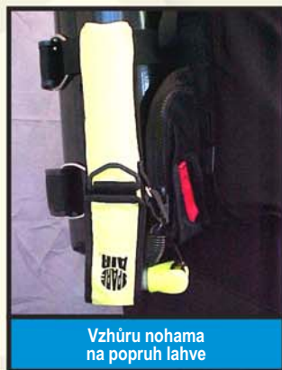
Vzhůru nohama na popruh lahve

⚠ VAROVÁNÍ: Nepřipevňujte pouzdro SPARE AIR k zátěžovému opasku, mohlo by překážet při vyndání zátěže v případě nouze a SPARE AIR byste mohli i ztratit.