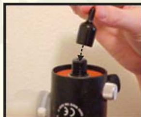
Nasaďte krytku na závit regulátoru.