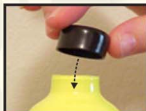
Nasaďte krytku pro zabránění znečištění vnitřní strany hliníkové lahvičky.