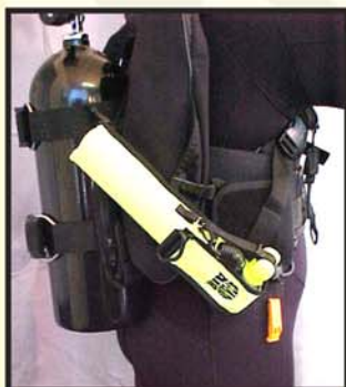
Diagonálně od lahve ke kompenzátoru vzlaku