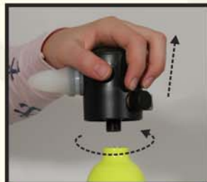
Vypusťte vzduch a odšroubujte regulátor proti směru hodinových ručiček.