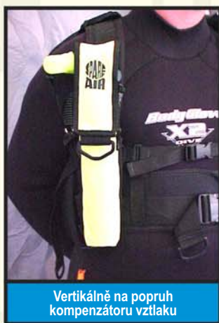
Vertikálně na popruh kompenzátoru vzlaku