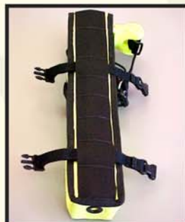
Provlékačí pásky s různými možnostmi upevnění