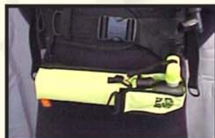
Přes pas (nepřipevňujte k zátěži!)